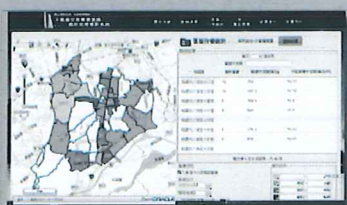
不動產交易實價登錄系統