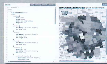
統計地圖API 範例網站