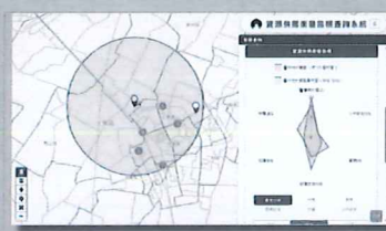
資源供需衡量指標查詢系統