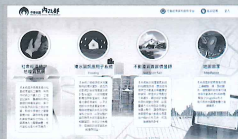
社會經濟統計地理資訊網