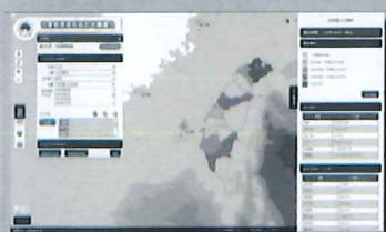
社會經濟資料統計地圖圖台