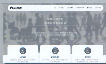
智慧人流統計應用指標查詢系統