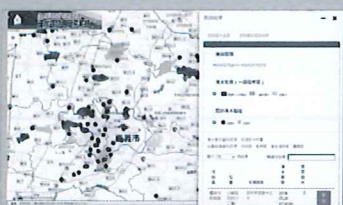
淹水資訊應用子系統