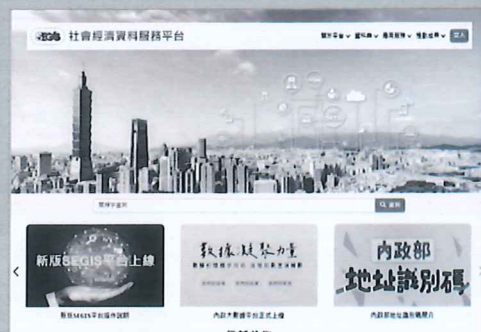
社會經濟資料服務平台