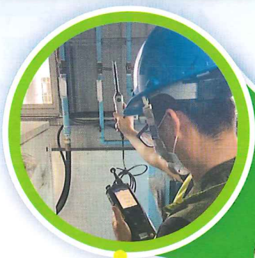
設備機房溫度檢測